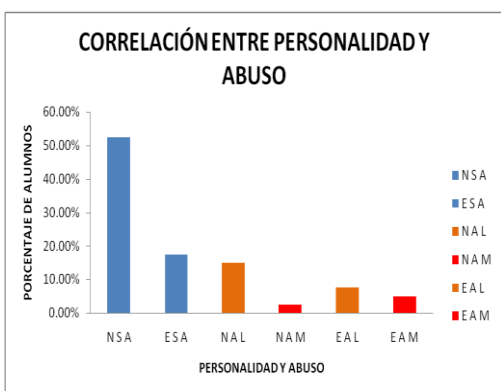
Figura 5. Nivel de correlación de abuso y personalidad

En la figura 4 se observa el porcentaje de alumnos con respecto a su personalidad, donde se muestra que el 70% se encontró en la normalidad, ya que su personalidad no es ni introvertida ni extrovertida. Por otra parte el 30 % restante de los participantes mostraron ser más extrovertidos, mientras que en el caso de la personalidad introvertida no se encontró ningún porcentaje de alumnos.