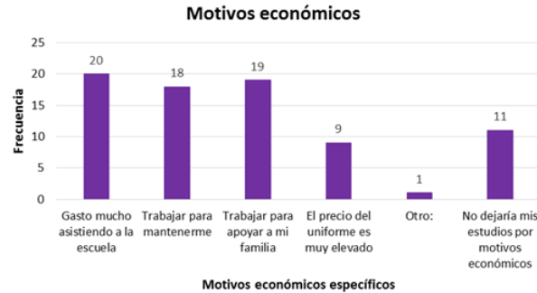
Figura 3. Frecuencia de respuestas relacionadas con los motivos económicos.

trabajar para apoyar a la familia fue la segunda pregunta con mayor número de respuestas, mientras que trabajar para mantenerse, fue la tercera opción.