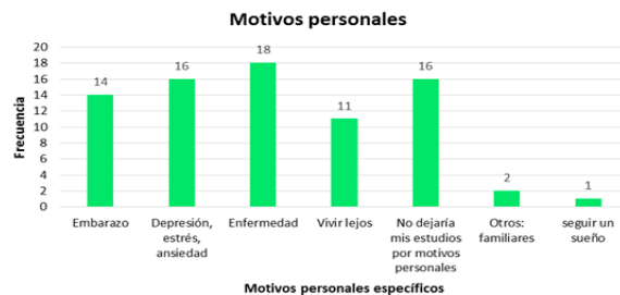
Figura 1. Frecuencia de respuestas relacionadas con los motivos personales.

La figura 1 corresponde a la primera dimensión (personales) en la que se halló que 18 alumnos por razón de alguna enfermedad sería su principal motivo por la que abandonarían sus estudios de bachillerato. En segundo lugar, se ubican empatados los motivos de depresión, estrés y ansiedad y que no dejarían sus estudios por motivos personales. Seguido de lo anterior, 14 alumnos indicaron que un embarazo también podría ser un motivo que influenciara en la decisión de abandono escolar.